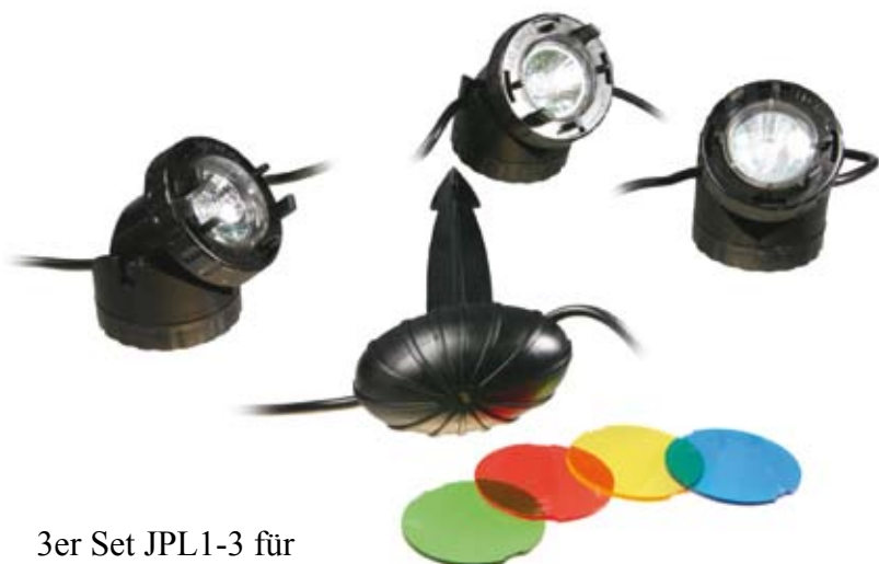
3er Set JPL1-3 für Folienteiche incl. Farbscheiben