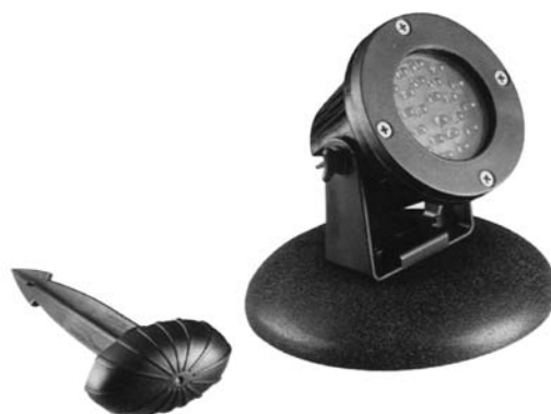
JPL-3 LED - Leuchte