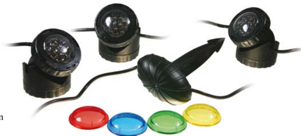
3er-Set LED-Leuchten JPL1-3LED für Folien- und Naturteiche incl. Farbscheiben

Alle Modelle werden mit einem Erddorn mit integriertem Lichtsensor (Dämmerungsschalter) ausgeliefert. Dieser schaltet die Leuchten in der Dämmerung automatisch ein und bei Tageslicht wieder aus.